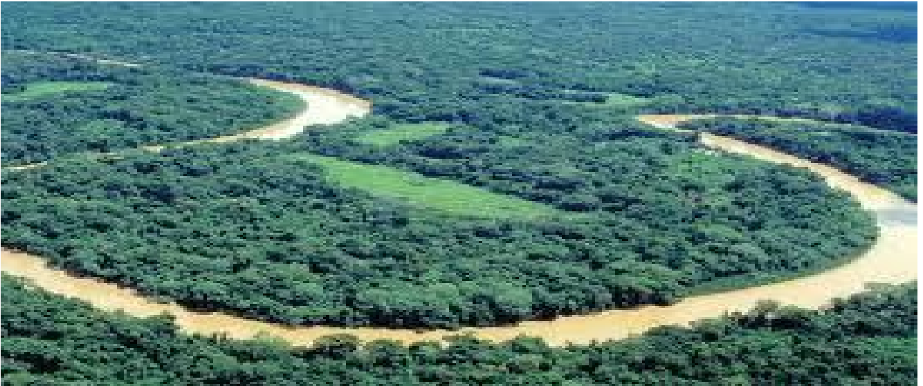
Selva beniana surcada por ríos

Como a medio día, se repartieron las cosas útiles, que habían encontrado en el abandonado campamento, y acto seguido se inició la caminata hacia el Beni.