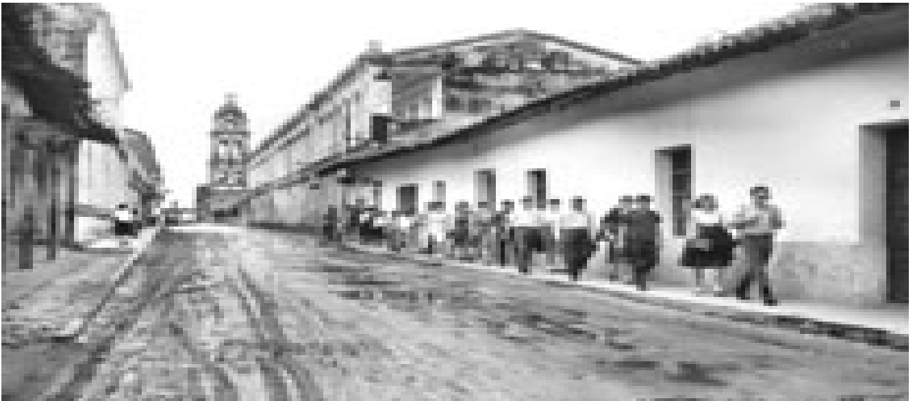
La ciudad de Santa Cruz de la Sierra durante las luchas cívicas de 1957, con calles llenas de agua y barro

Estas pugnas, crearon una confrontación con el gobierno central de imprevisibles consecuencias, la cual terminó con la retirada de los pocos pero valientes y bravos unionistas, hacia las inhóspitas y selváticas serranías del Amboró. Pero sí es bueno recalcar, que sin derramar sangre nuestra ni ajena, este acto de valor cívico, logró una rotunda victoria para nuestro pueblo, ya que se consiguió por fin la aplicación de la ley de regalías que llevaba 20 años de promulgada, pisoteada y distorsionada por los gobiernos que se fueron sucediendo.