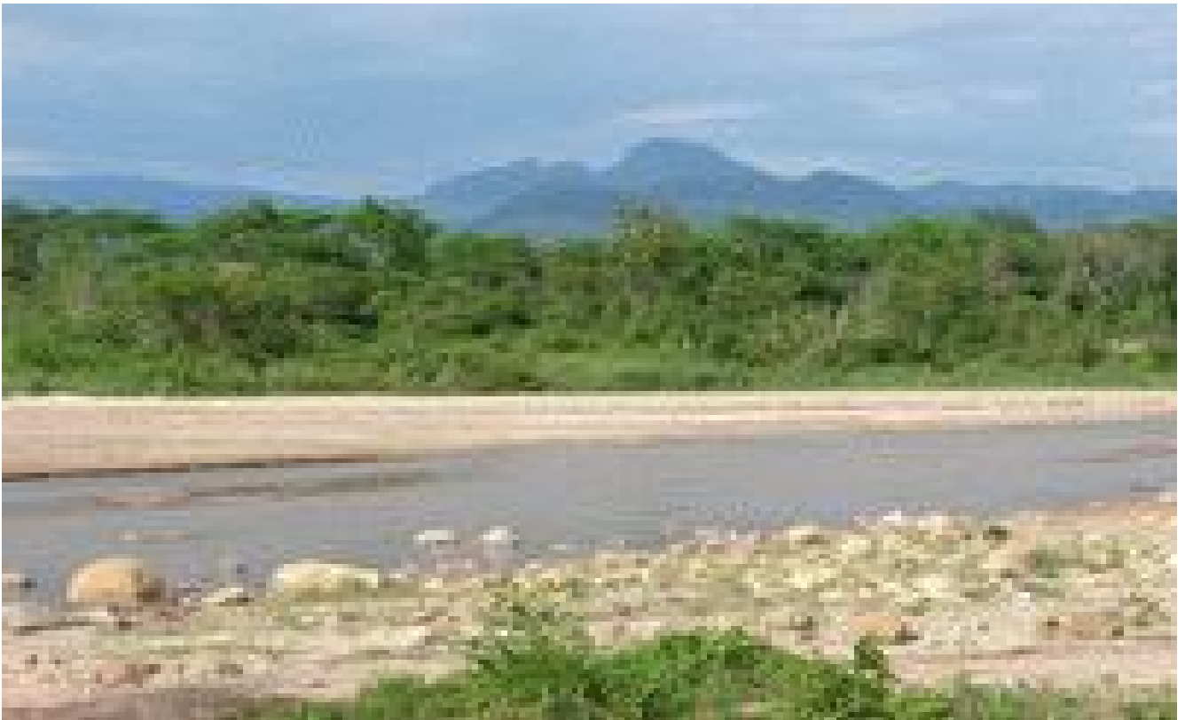
Vista panorámica de la serranía del Amboró

Estas pugnas, crearon una confrontación con el gobierno central de imprevisibles consecuencias, la cual terminó con la retirada de los pocos pero valientes y bravos unionistas, hacia las inhóspitas y selváticas serranías del Amboró. Pero sí es bueno recalcar, que sin derramar sangre nuestra ni ajena, este acto de valor cívico, logró una rotunda victoria para nuestro pueblo, ya que se consiguió por fin la aplicación de la ley de regalías que llevaba 20 años de promulgada, pisoteada y distorsionada por los gobiernos que se fueron sucediendo.