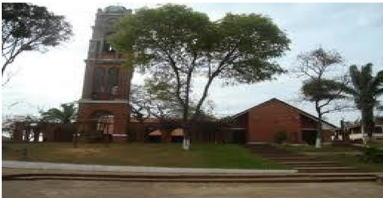
Iglesia de Buena Vista

La columna de camiones que transportaban a los derrotados unionistas, fue haciendo su ingreso por el lado sur del pueblo, y conforme fueron parando en la plaza, su gente se fue reuniendo y aglomerando alrededor de éstos. Hubo un momento en que llegaron a sobrepasar en número a los guardianes, los cuales se replegaron en actitud pasiva, no para evitar el contacto con la gentil muchedumbre; sino más que nada, para evitar que los cautivos aprovecharan la circunstancia para escapar, cosa que de todas maneras varios de ellos lo intentaron, pero con poca fortuna.