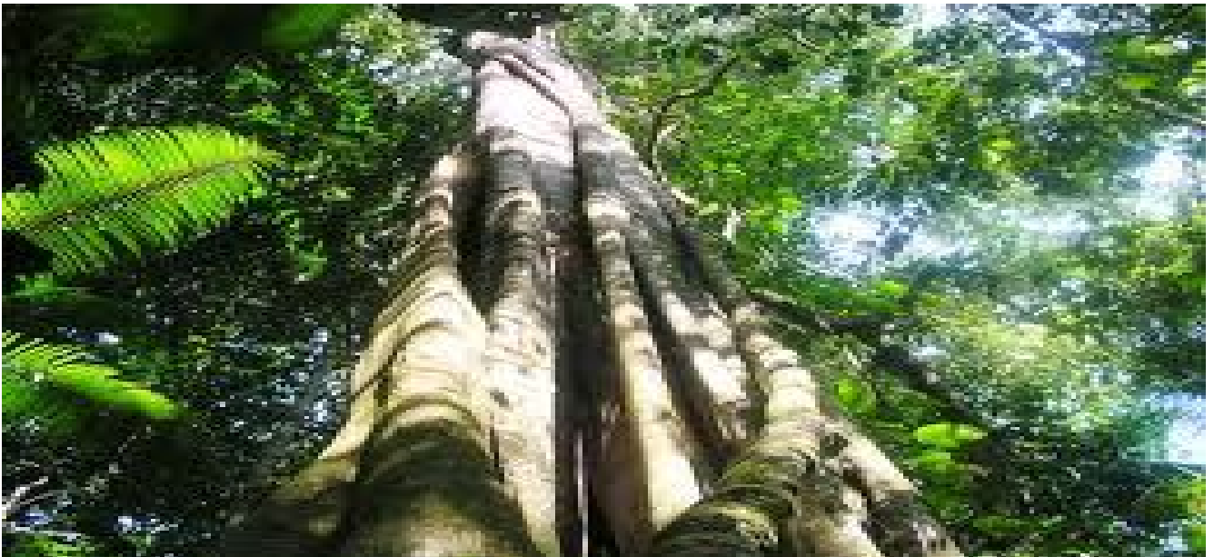
Árbol de Mara

Como al medio día y cuando el sol, calentaba con sus rayos y agredía en forma cruel a los caminantes, se hizo un paréntesis en la marcha. Se repartieron lo poco que habían guardado de la carne asada del caballo sacrificado en la jornada anterior, y satisfechos con la frugal comida, se cobijaron bajo un frondoso árbol de Jorori, descansando a perna suelta, como si se encontraran disfrutando de una placentera caminata de niños exploradores.