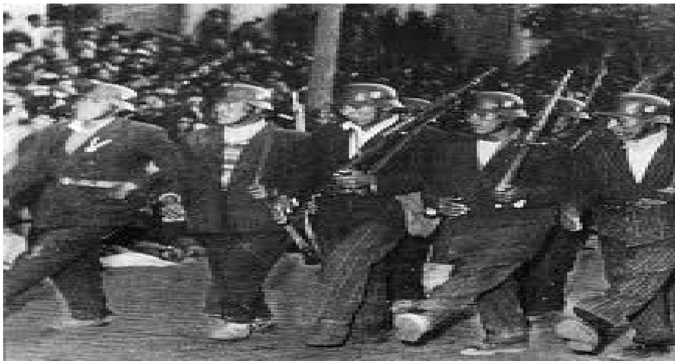
Milicianos del collado que invadieron Santa Cruz

Cuando los frustrados torturadores, se dieron cuenta que uno de los presos había logrado burlar lo palos y había escapado de la salvaje diversión, el más agresivo se abalanzó sobre éste y le propinó un fuerte puñetazo al estómago, cosa que por suerte tampoco le causo mucho daño.