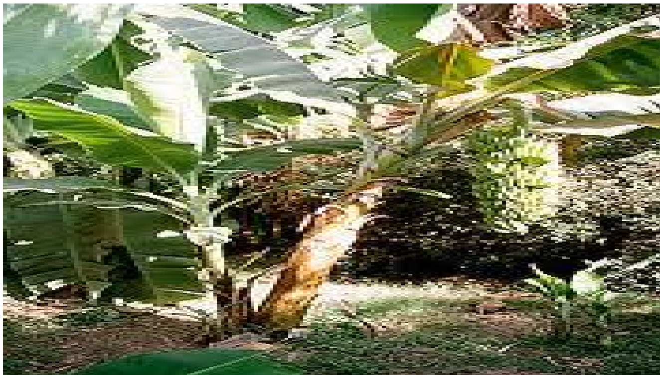
Barbecho con planta de guineo

Muchachos, parece que hemos hallado algo que comer. La senda se hace ancha más adelante, lo que con seguridad nos llevará a algún chaco cercano.