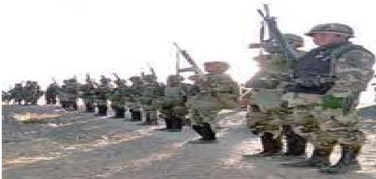
Ejército boliviano que invadió Santa Cruz

La extensión de la zona que pretendes utilizar como foco para nuestras operaciones es muy amplia, lo que diluirá nuestras fuerzas, siendo fácil que nos las copen. Bien sabes que nos están mandando más de diez mil hombres, entre Ucureños, milicianos, mineros y soldados del ejército. Estaríamos a merced de ellos, pues nos atraparían fácilmente.