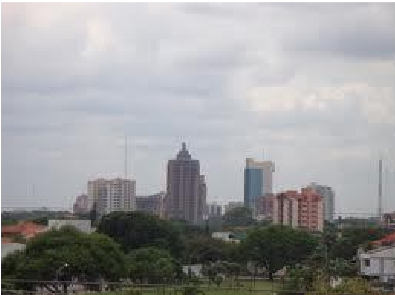
Santa Cruz de la Sierra gracias a las luchas cívicas de la década del 50

Debemos recordar, que todo pueblo que no reconoce a sus héroes y se olvida de sus gestas pasadas, es culpable de la pérdida de su identificación. Cosa que a la larga complota contra su futuro.