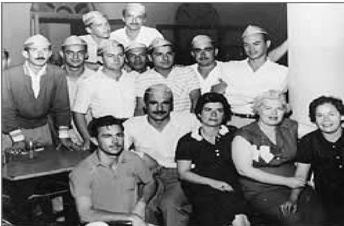
Miembros fundadores de la Unión Juvenil Cruceñista

Comparto plenamente la idea de Orlando, cuando plantea que en la ciudad capital, se debe abrir una avenida de la cruceñidad, para perpetuar en la memoria de las generaciones venideras, el recuerdo del comportamiento heroico de los jóvenes cruceños, que se constituyeron en el brazo armado de las aspiraciones del terruño en los años 1957 y 1959. La Unión Juvenil Cruceñista, 4 merece un sitio de honor en el corazón de éste pueblo.