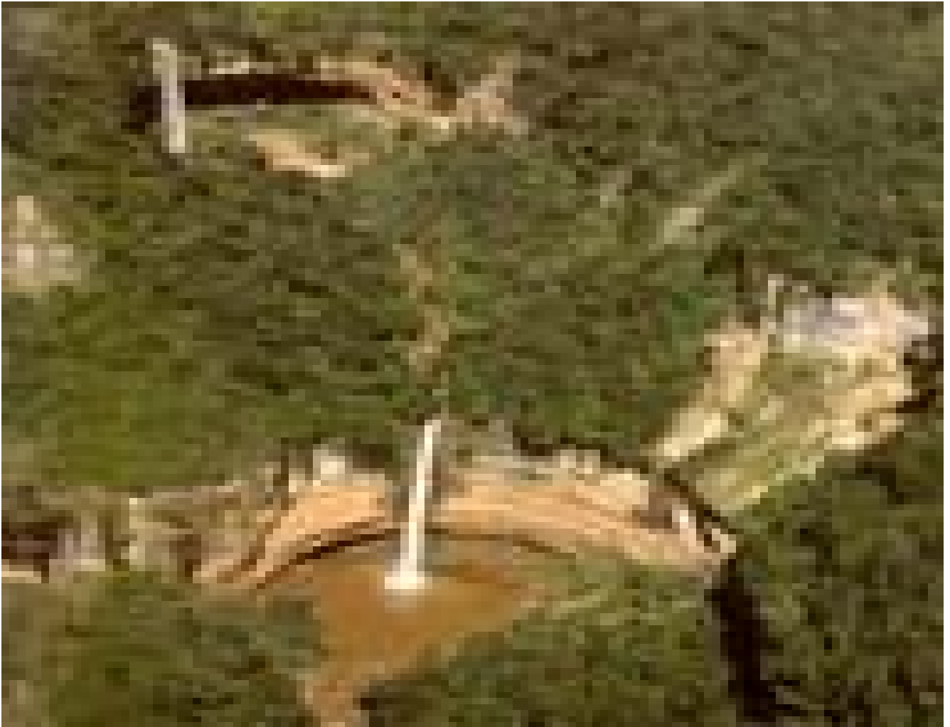
Cataratas del nacimiento del río Surutú

Me parecieron acertadas las apreciaciones del autor sobre lo que se hizo y sobre lo que debió hacerse. Es cierto cuando afirma de que no todos estábamos de acuerdo, con el rumbo que el presidente y directorio de la Unión Juvenil Cruceñista le dieron a la columna, porque más allá del Surutú 3 la zona era abrupta, inhóspita y deshabilita; pero en la guerra las órdenes se cumplen y no se discuten.