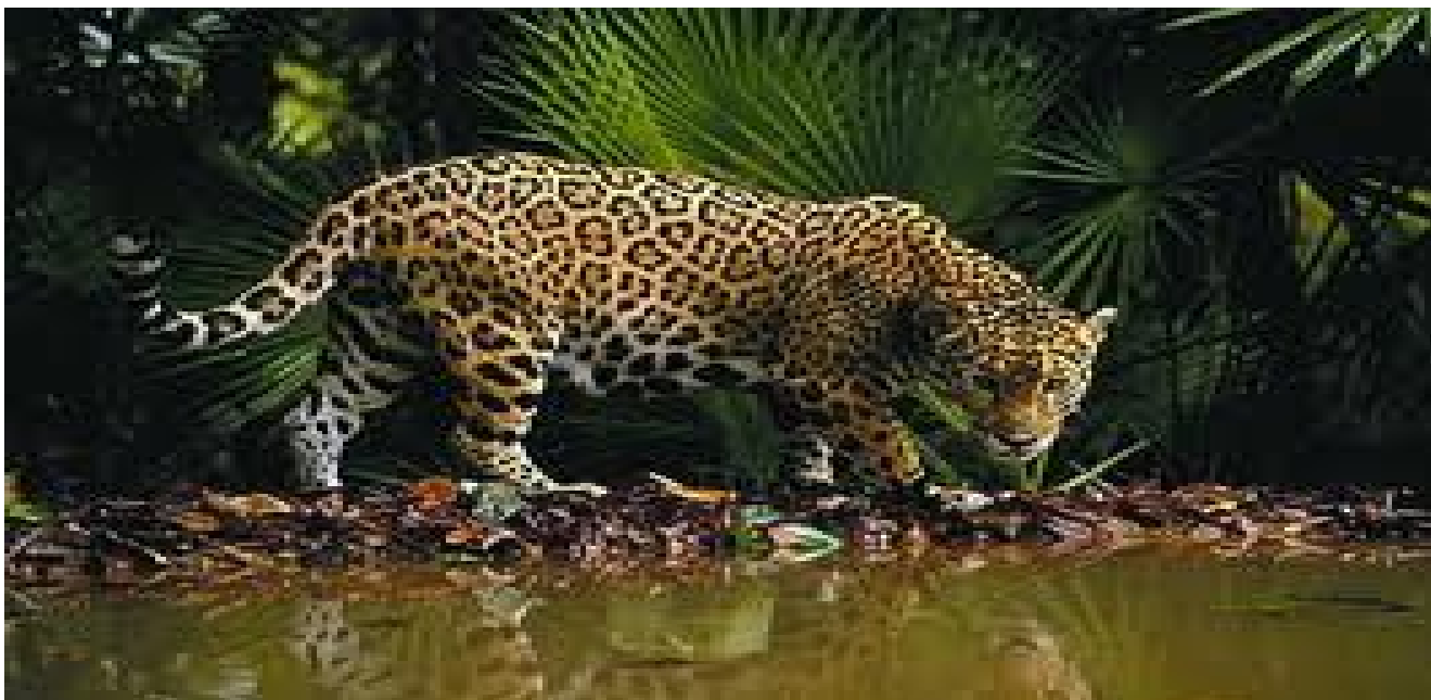
Tigre a orillas del arroyuelo

No habían caminado más de una hora por la orilla del riachuelo, sorteando un pedregoso y sinuoso terreno, que además se hacía enmarañada por bejucos, que en muchas partes dificultaban la marcha. Cuando al doblar un recodo del arroyo, a pocos metros; se divisó un majestuoso tigre, que nos miraba desdeñosamente y con su acostumbrada soberbia de Rey de nuestras selvas americanas. Se cantoneó, como adivinando que se encontraba ante la presencia de muchachos inofensivos. Saltó y desapareció.