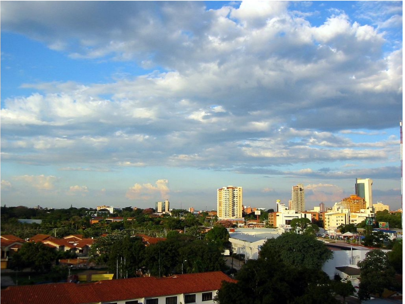
Vista actual de la ciudad de Santa Cruz de la Sierra

En fin, lo que busco con este trabajo, el que está hecho con mucho amor por el terruño, es, aparte de hacer una cronología de los hechos, principalmente llevar un verdadero mensaje de solidaridad y hermandad, para todos los que pueblos esta heredad. Sena oriundos o no, un mensaje que contribuya a mostrar los valores un poco dormidos pero no olvidados, de la tradicional hospitalidad del de los llanos orientales.