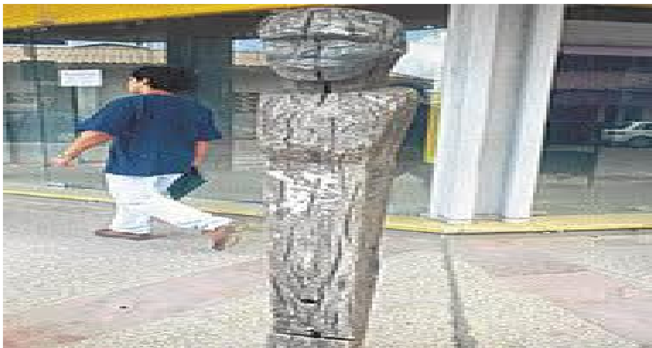
Calles Republicuetas y Rene Moreno el Mojón con cara